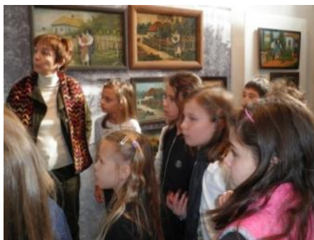
Visite des CE2 au musée Gonchar (Arts populaires d'Ukraine)

Les classes de CM1 et CM2 ont entrepris un cycle de course d'endurance. Un cross est prévu jeudi 21 dans le parc de la rue Kotsyubynskogo, en face de l'ambassade des Etats-Unis. Il sera suivi par une chasse au trésor. Des coupes et des médailles seront à gagner. Un chocolat chaud attendra tous les participants à l'issue des épreuves.